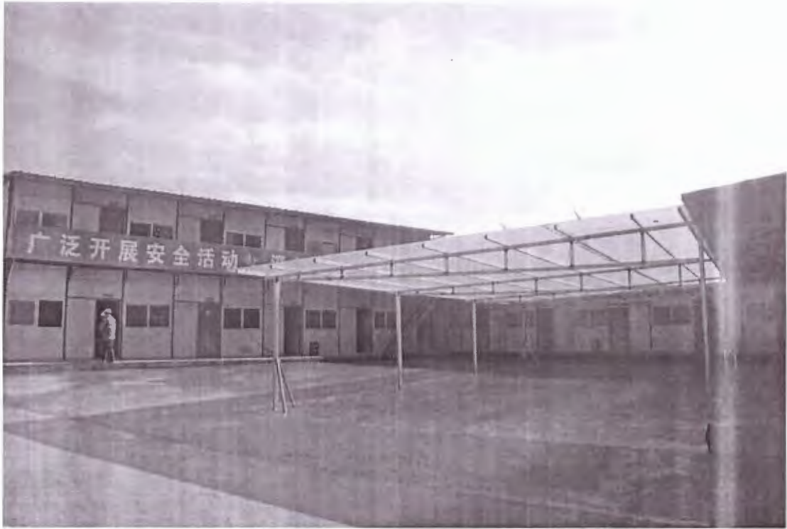
生活区卫生清理，洒水降尘